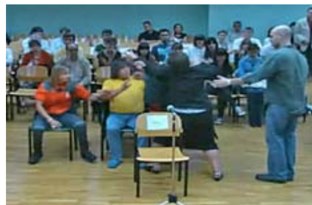
Captura del intento de agresión, ayer en Pamplona.