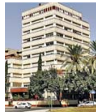
Jefatura de Policía de Sevilla.